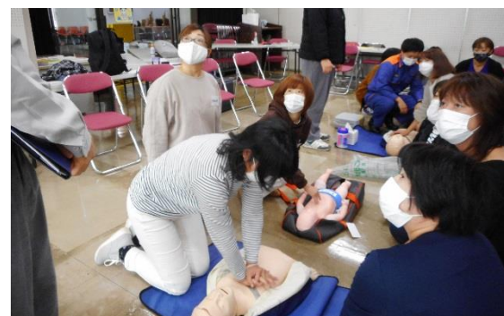
令和2年 講習会の様子

9月下旬より10月上旬にかけて平日に開講します。地域における保育サービスを川俣町役場担当者から、子どもとの関わりについてはかわまた認定こども園の先生から、安全・事故・緊急時の対応については消防士からなど、子育てについて学び、地域での子育て支援のお手伝いをしてみませんか。詳細が決まり次第、別紙にてご案内いたします。ぜひ、ご参加ください！