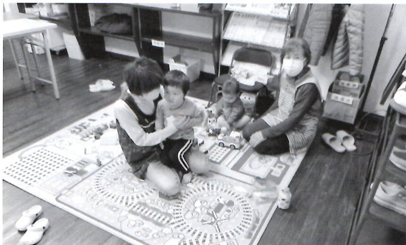
同じお部屋で一緒に

「今度ファミサポ講習会があるけど参加しない？」 「午前中は時間ができたので、講習会を受けて今度はスタッフとして活動したいなあ」